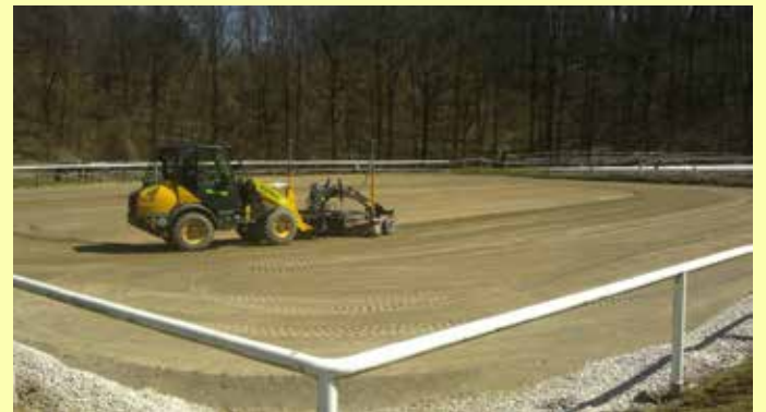
Einbau von RIPROCRETE beim Aussenreitplatz RC Steyr 1400m 2