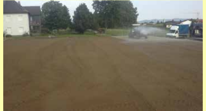
Bewässern der RIPROCRETE Trennschicht