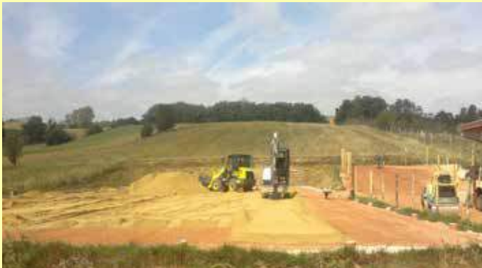
Einbau von RIPROCRETE auf dem Reitplatz

A-4491 Niederneukirchen Ruprechtshofen 20 Tel.: +43 (0)676 87837186 Fax: +43 (0)732 210100041 Mail: zentrale@ripro.at www.ripro.at