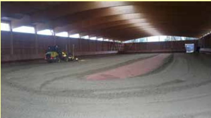
Einbau von RIPROCRETE in einer Reithalle